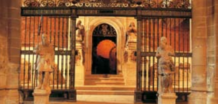
Panteón Real de Santa María la Real de Nájera.