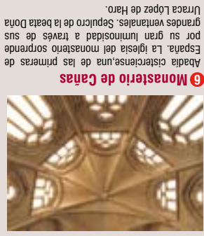
6 Monasterio de Cañas Abadía cisterciense una de las primeras de España. La iglesia del monasterio sorprende por su gran luminosidad a través de sus grandes ventanales. Sepulcro de la beata Doña Urraca López de Haro.