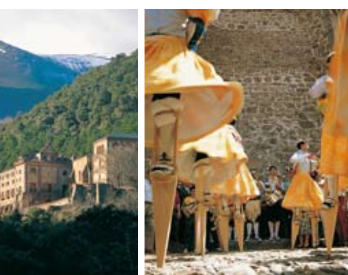
Monasterio de Valvanera.

Esta espectacular danza, declarada de interés nacional, se realiza sobre zancos de madera , de 45 centímetros de altura, por parte de ocho jóvenes del pueblo que, ataviados con chalecos de colores y faldones amarillos, se lanzan desde la iglesia por la cuesta empedrada hasta la plaza de Anguiano. Cada 22 de Julio , Fiesta de la Magdalena, mañana y tarde y el último sábado de Septiembre. Hay documentos escritos sobre la danza de Anguiano fechados en 1603, aunque se supone un origen mucho más antiguo. Se trata en todo caso de la manifestación folclórica más antigua de La Rioja .