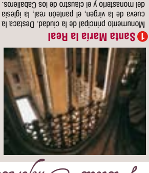
1 Santa María la Real Monumento principal de la ciudad. Destaca la cueva de la Virgen, el pabellón real, la iglesia de Santa María la Real.