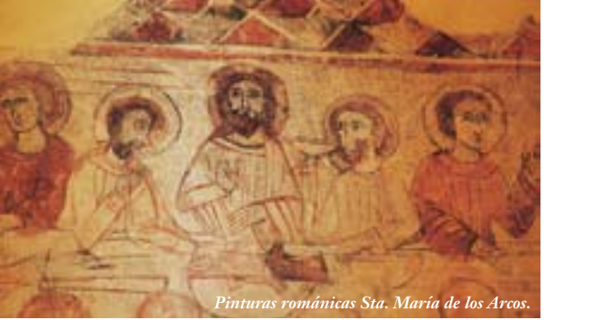
Pinturas románicas Sta. María de los Arcos.

Su principal monumento es la Basilica de Santa Mª de los Arcos , el monumento religioso más antiguo de La Rioja. En origen fue un mausoleo romano del siglo III , transformado en basilica cristiana en el siglo V , reutilizando elementos arquitectónicos procedentes de la antigua ciudad romana de Tritium Megallum . Tricio la Grande, que comprendía el actual pueblo de Tricio, Nájera y otras localidades próximas. Bajo el suelo de la basilica se descubrieron enterramientos de tumbas paleocristianas de los siglos V y VI , algunos sarcófagos romanos de los siglos I al III d. C. reutilizados, y otros medievales; además de estelas funerarias romanas y otra paleocristiana. En la cabecera se conservan restos de pinturas románicas de finales del siglo XII , repintadas sobre las originales paleocristianas del siglo V . El edificio tiene estructura basilical con planta longitudinal de tres naves y cabecera cuadrangular. Las naves laterales están separadas de la central por arquerías apoyadas en columnas corintias formadas por fragmentos de columnas romanas del siglo I . En el siglo XVIII el interior de la basilica se cubrió con yeserías barrocas. La talla original de la Virgen de Arcos, una Virgen negra prerrománica, del siglo XI , se encuentra en la iglesia parroquial de Tricio.