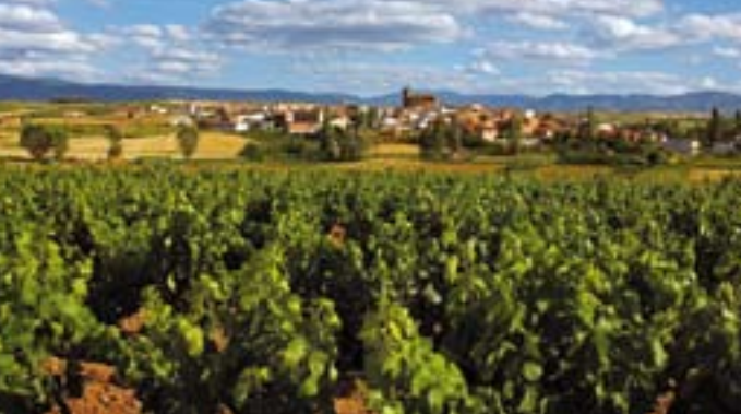
Panorámica de Azofra.

En el Camino, antes de llegar a Nájera, un cerro sobresale aislado sobre los demás: el mítico “Poyo Roldán” , escenario de otra variante de esas leyendas evocadoras de luchas entre caballeros medievales, tan extendidas por aquellos lugares del Camino de Santiago donde mayor influencia tuvo la Orden de Cluny. Se trata del relato que narra el combate entre el gigante Ferragut y Roldán, caballero al servicio de Carlomagno.