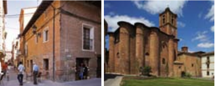
Calle típica najerense.