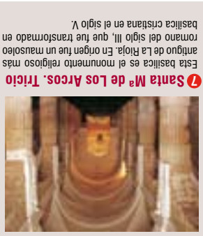
7 Santa Mª de Los Arcos, Tricio Esta basílica es el monumento religioso más antiguo de La Rioja. En origen fue un mausoleo romano del siglo III, que fue transformado en basílica cristiana en el siglo V.