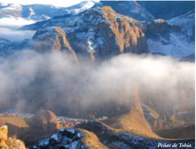
Peñas de Tobía.

El área recreativa de El Rajao , cercana a Matute y a las peñas de Tobía es un punto de partida ideal para realizar senderos o bicicleta de montaña, así como para disfrutar de un día al aire libre. Pasear por esta zona, especialmente bonita en otoño, permite disfrutar de bosques frondosos de colores ocres y pequeñas cascadas y riachuelos.