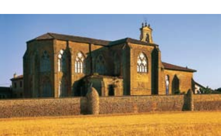
Abadía cisterciense de Cañas.

Aunque data del año 1054, el templo actual fue consagrado en 1611. Está construido en piedra sillar y consta de tres naves y nueve altares. Alberga las reliquias de San Prudencio , entre otros santos y cuadros procedentes de Santa María la Real.