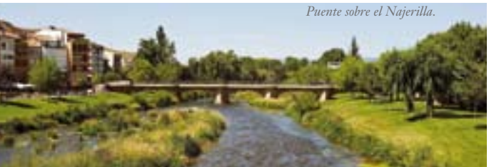
Puente sobre el Najerilla.

La denominación de Nájera proviene del ascendiente árabe Naxara , lugar entre peñas. Según se desprende de yacimientos prehistóricos, el valle del Najerilla fue habitado por el hombre del paleolítico superior e inferior. También se establecieron en ella tribus celtas. Alrededor del 714, los árabes convirtieron a Nájera en fortaleza y baluarte de La Rioja Alta. En el año 918 nace el reino de Nájera , al entregar el rey de Pamplona, Sancho Garcés a su hijo García Sánchez las tierras del Ebro desde Miranda hasta Tudela. Fue reocupada por los árabes y posteriormente reconquistada por el rey Ordoño II, y fue entregada a García Sánchez. A partir de entonces se instaló en Nájera la corte navarra, convirtiéndose en capital del reino y cuna de reyes .