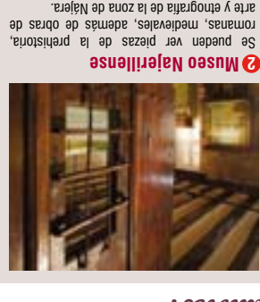
2 Museo Najerlense Se pueden ver piezas de la periferia romana, medieval, además de obras de arte y etnografía de la zona de Najera. Monumento principal de la ciudad. Destaca la cueva de la Virgen, el pabellón real, la iglesia de Santa María la Real.