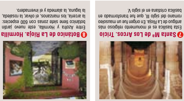
8 Botánico de La Rioja, Hormilla Entre Azofra y Hormilla, este nuevo jardín botánico tiene siete zonas con 600 especies: la acera, los manzanos, el viver, la rosaleda, la laguna, la alameda y el invernadero.