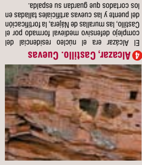
4 Alcazar, Castillo, Cuevas El Alcazar era el núcleo residencial del castillo, ha murallas de Najera, la fortificación medieval formada por el complejo defensivo medieval formado por el castillo, hasta su separación en 1230.