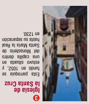
3 Iglesia de la Santa Cruz Esta parroquia se fundó en 1052, y una capilla dentro del Monasterio de Santa María la Real.