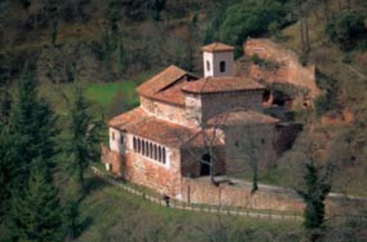
Vista de Suso.

Los pasos del Santo – Ruta de Gonzalo de Berceo: duración aproximada de dos horas, al tratarse de un sendero circular, tomaremos como punto de referencia de salida el Monasterio de Yuso y atravesaremos la localidad de San Millán para llegar hasta Berceo y de allí hasta el Monasterio de Suso por camino (es necesario saber que el hecho de subir caminando a Suso no implica poder acceder al interior del monasterio salvo que estén en posesión de la pertinente entrada), desde Suso parte la senda que nos llevará de nuevo hasta el Monasterio de Yuso.