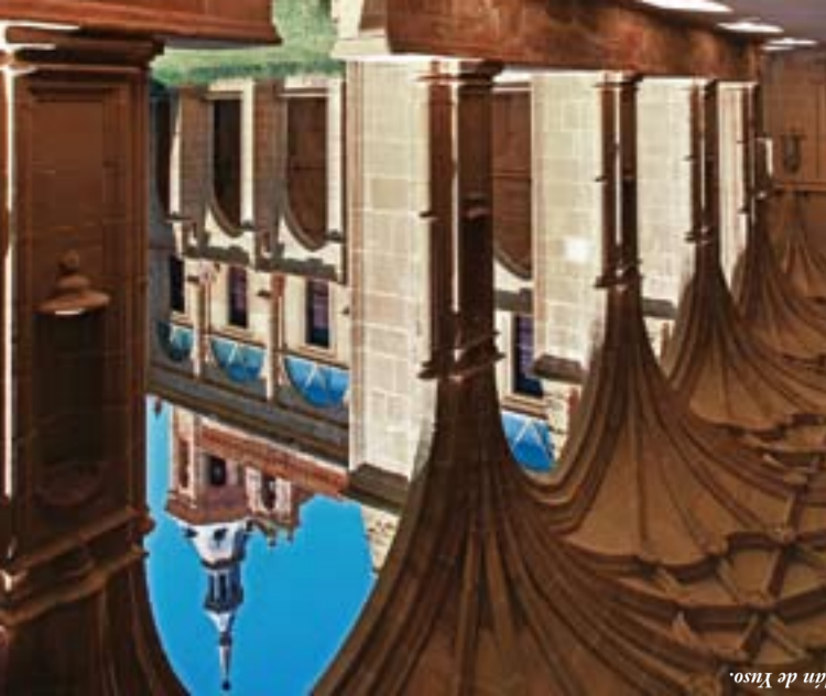
Claustro de San Millán de Yuso.