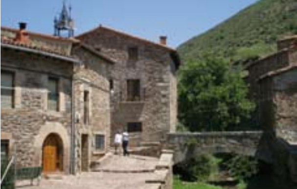
Viniegra de Arriba.

Constan testimonios históricos de esta villa desde el siglo X, ya que un sacerdote de la localidad fundó en esa época un oratorio que sería el embrión del monasterio de Valvanera. Brieva acogió a la patrona de La Rioja durante la desamortización de Mendizábal hasta la apertura del monasterio. La ganadería y la trashumancia han marcado la vida de esta localidad. De gran interés paisajístico, desde Brieva se puede ver la imponente belleza de la Sierra de Cameros.