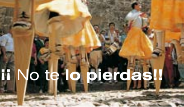
Vista de la Sacristía de Yuso.

La estantería de los cantorales del monasterio conserva en su haber veinticinco volúmenes copiados entre 1729 y 1731. El archivo y biblioteca monasterial de gran valor para los investigadores está considerado entre los mejores de España. Es la biblioteca monástica más íntegra del país. Su verdadero valor e interés radica, no tanto en su número - más de diez mil - , como en los ejemplares raros que conserva. No está abierta al público ya que se dedica exclusivamente a la investigación.