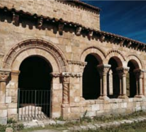
Iglesia de San Cristobal, Canales de la Sierra.

Canales de la Sierra Atravesado por el río Najerilla, su casco urbano está unido con pequeños puentes de piedra de gran belleza. Al norte de la población se ballan los restos de un antiguo poblado romano, la ciudad de Segeda, primitivo asentamiento de la villa de Canales. La Iglesia de San Cristóbal es el monumento principal de esta localidad. Una joya románica del siglo XII con otros elementos de finales del XVII. Consta de una sola nave, con pórtico con recubrimbre de madera. La galería porticada, de estilo castellano, es única en toda La Rioja. De su interior destaca la pila bautismal del siglo XII.