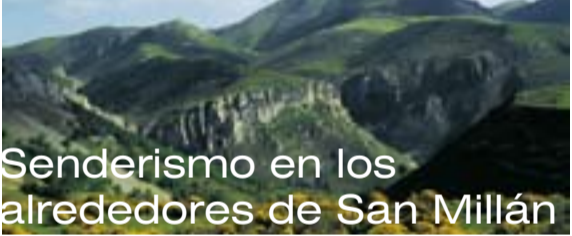
Sendero de San Millán de Suso, en el valle del Oja, en el término municipal de Suso.

En la primera mitad del siglo X se construye el monasterio mozárabe , consagrándose en 959 por García Sánchez I , primer monarca instalado en Nájera. A esta etapa corresponde la galería de entrada y la nave principal de la iglesia, construida con bóvedas de estilo califal y arcos de herradura. En el año 1002, Almanzor incendió este monasterio, y desapareció con ello la decoración pictórica y los estucos mozárabes.