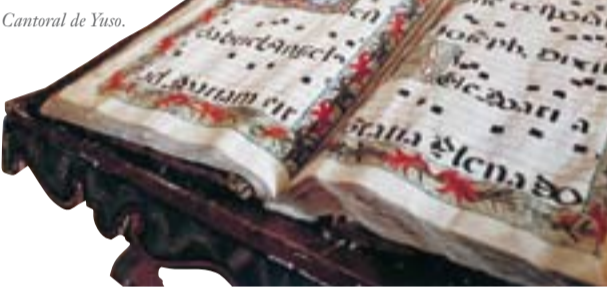
Cantoral de Yuso.