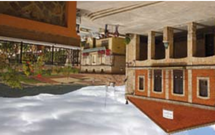
Plaza de Berceo.

Y almacenes que se transformaron en viviendas con el paso del tiempo.