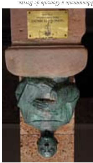
Monumento a Gonzalo de Berceo.