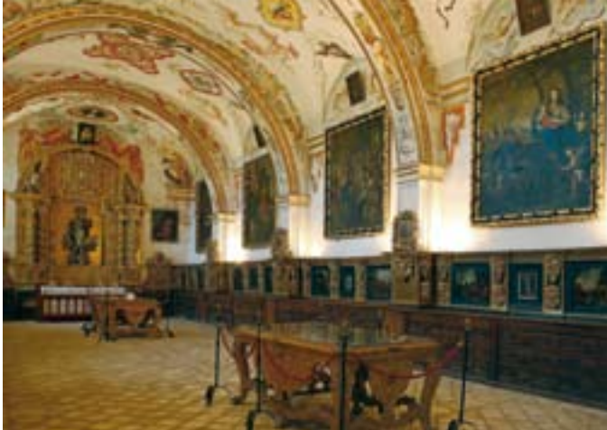
Sacristía de Yuso.

Esta localidad de tradicionales edificios con berúldica se divide en dos barrios. Se puede visitar la torre con reloj en lo alto de un risco que domina el pueblo y el museo etnográfico que guarda mas de 2.000 piezas. Es de gran interés también un rollo picota de cuatro cabezas y el puente de la biedra, en la carretera comarcal poco antes de la Venta de Goyo.